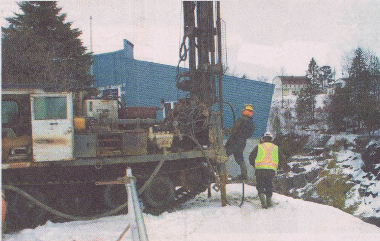
Forage à travers les rochers