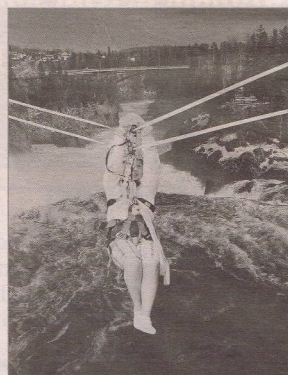
Voici un montage photographique donnant un aperçu de ce à quoi pourraient ressembler les sensations que vivront ceux qui utiliseront les tyroliennes des chutes de Grand-Sault.

Il a ajouté que les baby-boomers sont ceux qui essaient le plus les tyroliennes, avec les jeunes de 16 à 19 ans, toujours à la recherche de sensations fortes.